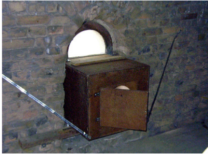
Innenansicht: Einbau in Fenster