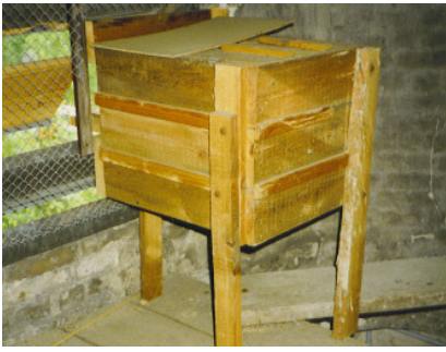
Beispiel eines Nistkastens – innen angebracht