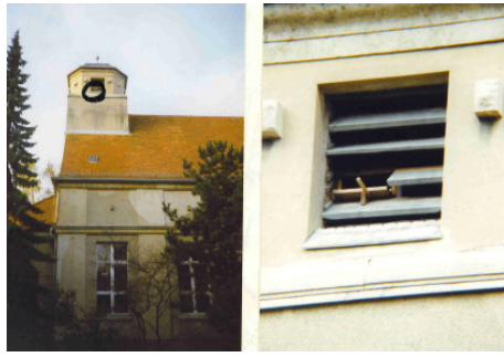
Außenansicht: Einflugöffnung und Anflugstange