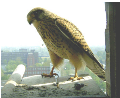
Weibchen auf dem Anflugbrett eines Nistkastens