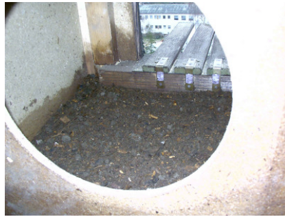
Einstreue ist wichtig für den Turmfalke (Erde-Sand-Gemisch)!