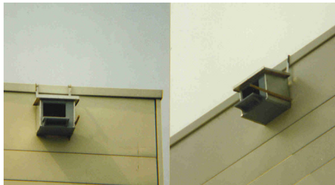
Diese Außennistkästen sind mit Zinkblech verstärkt, so dass sie vor Witterungseinflüssen geschützt sind.