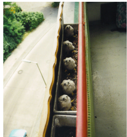
Dies sollte nicht passieren: Turmfalkebrut in einem Blumenkasten auf Balkon wegen Nistplatzmangel!